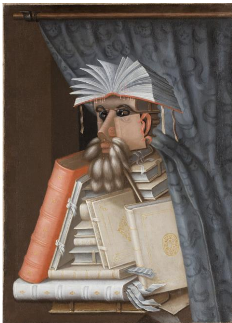
Giuseppe Arcimboldo El bibliotecario, 1562* Óleo sobre lienzo 97 x 71 cm

*Reproducción a tamaño real de la obra original, que se conserva en el Museo del Castillo de Skokloster en Suecia.