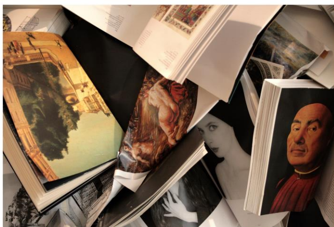
Inbreeding 2, 2011 Impresión a color sobre papel fotográfico Edición 1 de 3 80 x 100 cm Ref. (36) BY-07

*Reproducción a tamaño real de la obra original, que se conserva en el Museo del Castillo de Skokloster en Suecia.